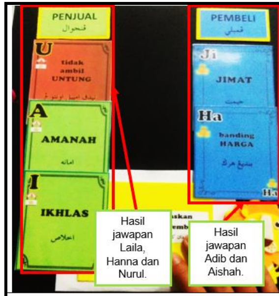
Rajah 6. Jawapan Peserta Kajian dalam Permainan Kad Adab.

Berdasarkan Rajah 6, kesemua jawapan yang diberikan adalah betul kerana Adab yang dimasukkan bertepatan dengan Adab Penjual dan Adab Pembeli. Penggunaan warna pada kad turut membantu peserta kajian mengecam jawapan yang betul.