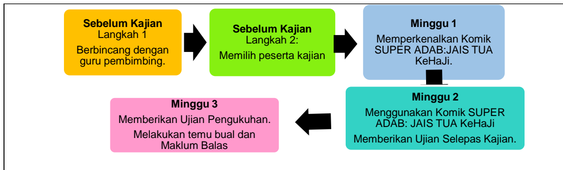
Rajah 1. Langkah Pelaksanaan Tindakan.